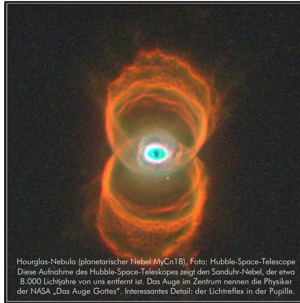
Hourglass-Nebula (planetarischer Nebel MyCn18), Foto: Hubble-Space-Teleskop Diese Aufnahme des Hubble-Space-Teleskops zeigt den Sanduhr-Nebel, der etwa 8.000 Lichtjahre von uns entfernt ist. Das Auge im Zentrum nennen die Physiker der NASA „Das Auge Gottes“. Interessantes Detail: der Lichtreflex in der Pupille.

So würde es in einem Reiseführer „Per Anhalter durch die Galaxis“ stehen, zusammen mit dem Hinweis, dass der Planet unter Quarantäne steht, weil die Spezies Mensch aus eigener Kraft den Sprung ins Bewusstsein schaffen muß. Dazu muß sie herausfinden, was Bewusstsein eigentlich ist. Das wird ihr das Tor in eine neue Realität öffnen.